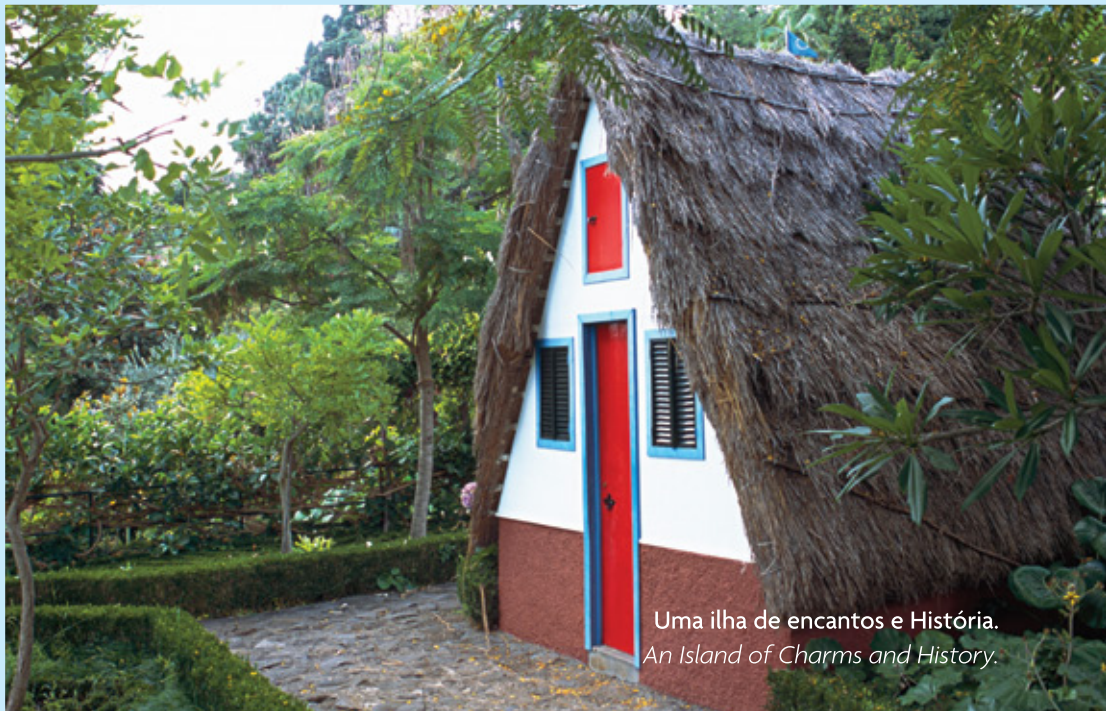
Uma ilha de encantos e História. An Island of Charms and History.